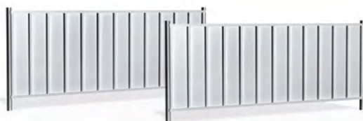
Przęsło pełne niskie