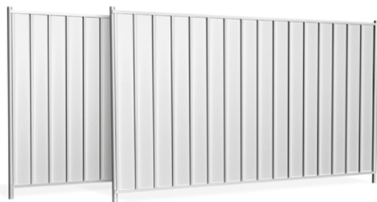
Standard - ocynk - bez malowania

Przęsła pełne z ocynkowanej blachy trapezowej